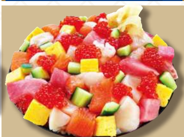
特上ばらちらし 2,180円