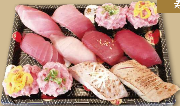
まぐろづくし握り

・大とろ・中とろ・中巻ねぎとろ・中巻とろタク【各2切づつ】 まぐろ・びんとろ・漬まぐろ・上赤身・まぐろ塩ダシ炙り・ 中とろ炙り ※中巻(たくあん、きゅうり、大葉)入り