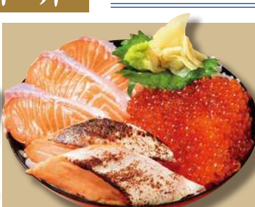
サーモン親子丼 1,680円