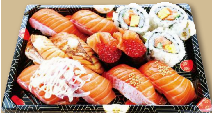
サーモンづくし握り

・サーモン・大とろサーモン炙り・サーモン親子(軍)・ オニオンサーモン・漬けサーモン【各2貫】 ・サーモンマヨネーズ巻【3貫】