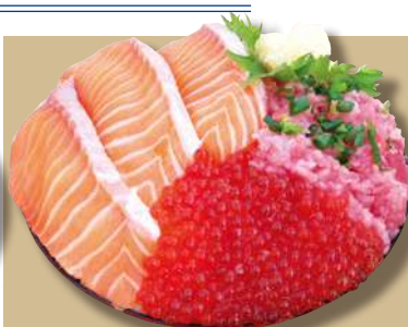
サーモンいくらねぎとろ丼 1,680円