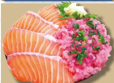
サーモンねぎとろ丼 1,200円