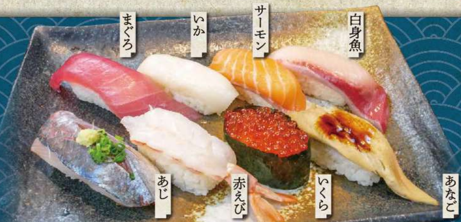
握りランチ 1,000円 みそ汁付き