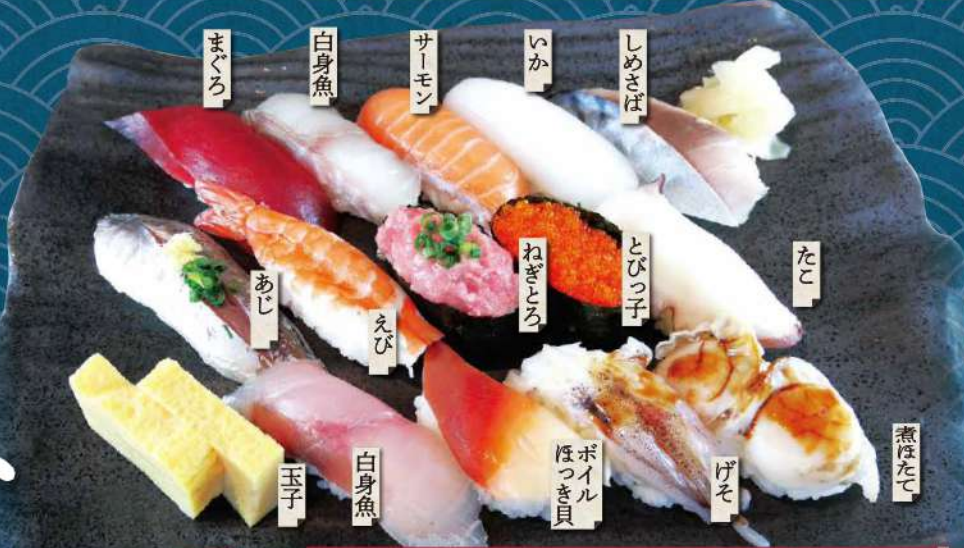
大漁握りランチ 1,580円 みそ汁付き