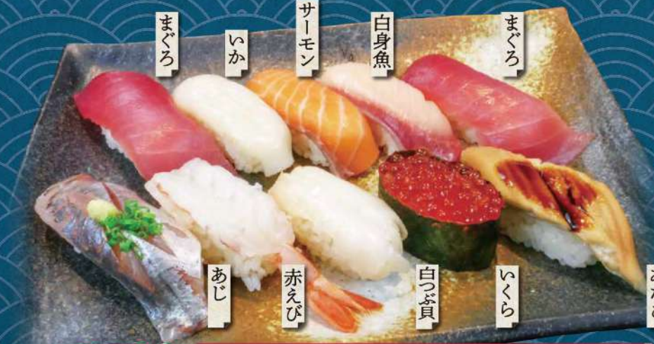
特選握りランチ 1,280円 みそ汁付き