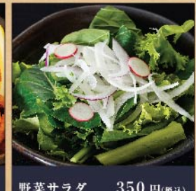
野菜サラダ 350 円(税込) 野菜サラダ(大) 550 円(税込)