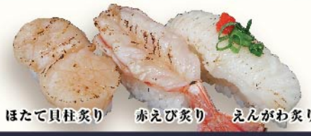
ほたて貝柱炙り 赤えび炙り えんがわ炙り