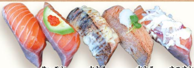
サーモン サーモン アボカド 大とろサーモンマヨ炙り 大とろサーモン炙り オニオンサーモン