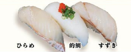
ひらめ 的鯛 すずき