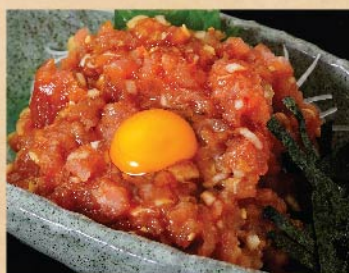
ねぎとろユッケ 580 円(税込)