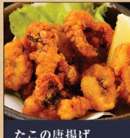
たこの唐揚げ 480 円(税込)