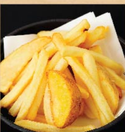
ポテトフライ 160 円(税込)