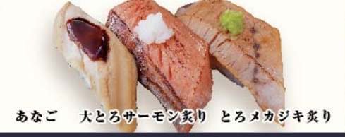
あなご 大とろサーモン炙り とろメカジキ炙り