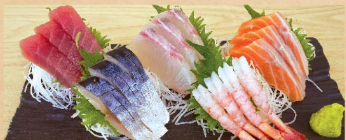
刺身五点盛 1,800 円(税込)