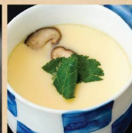
茶碗蒸し 290 円(税込)