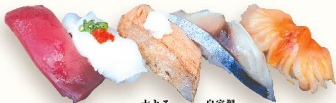
上赤身 生たこ 大とろサーモン炙り 自家製しめさば 活赤貝