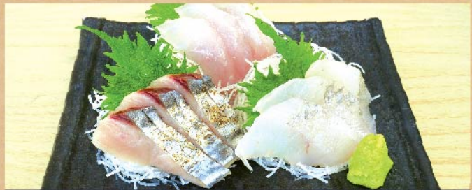
地魚三点盛 1,200 円(税込)