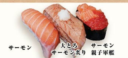
サーモン 大とろサーモン炙り サーモン親子軍艦