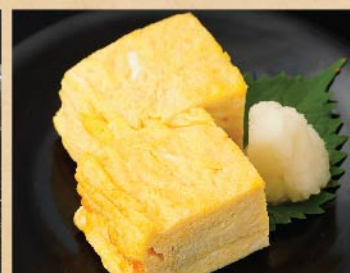
自家製だし巻き玉子 350 円(税込)