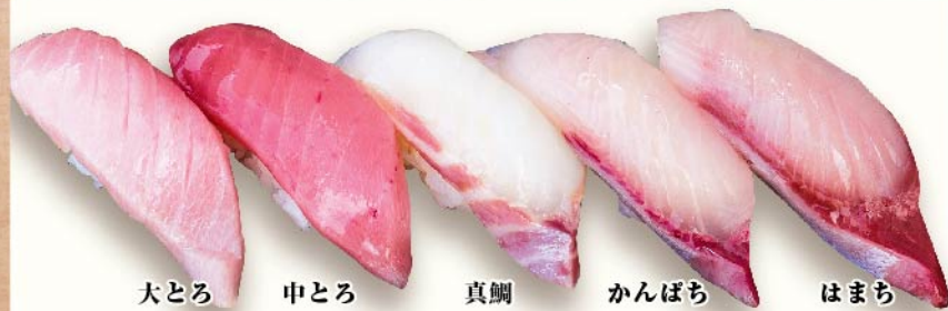
大とろ 中とろ 真鯛 かんぼち はまち