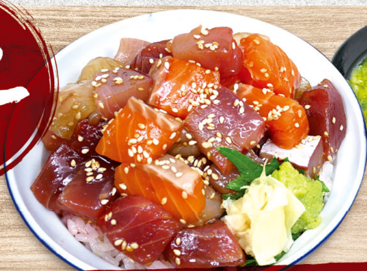
あれこれ海鮮漬け丼 1,580円