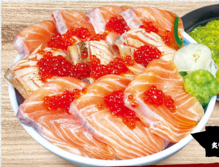
サーモン 炙りサーモン・いくら