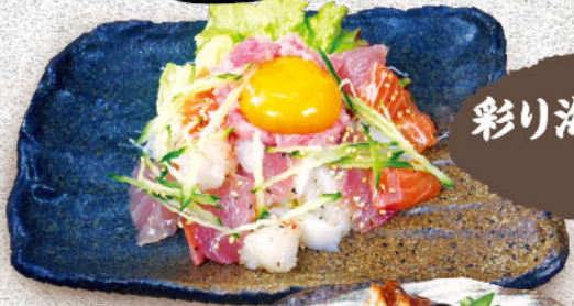
彩り海鮮ユッケ 880円