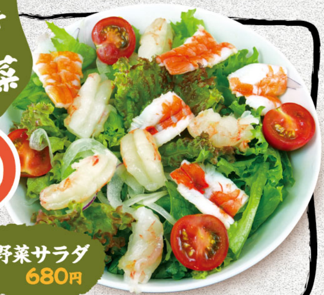
海鮮野菜サラダ 680円