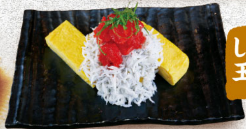
しらす明太子 玉子焼 580円