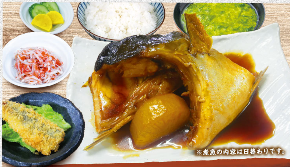
魚屋の煮魚定食 1,580円