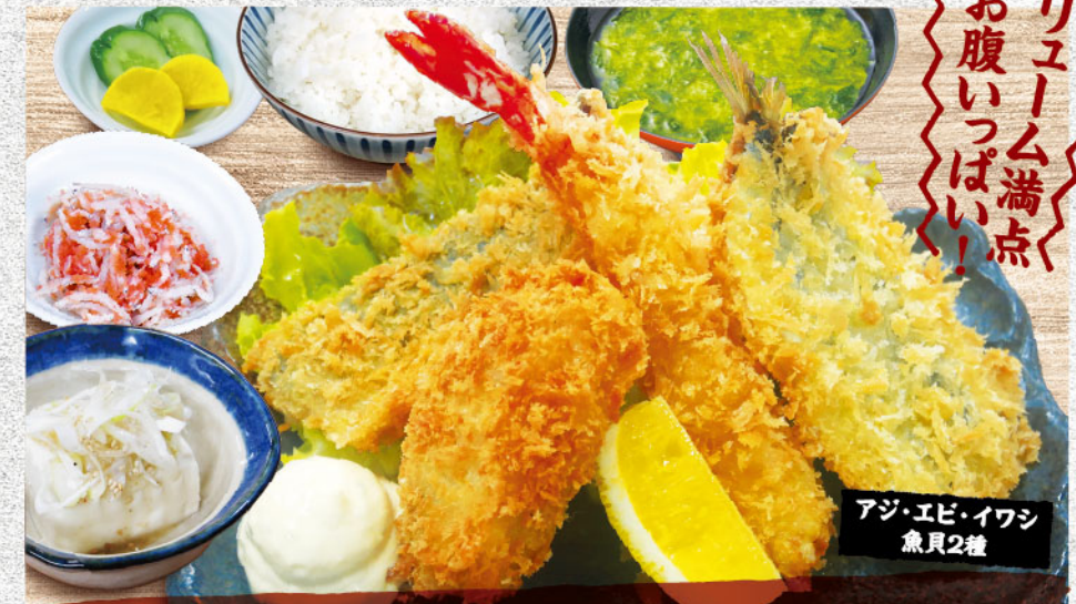
ミックス5フライ定食 1,680円