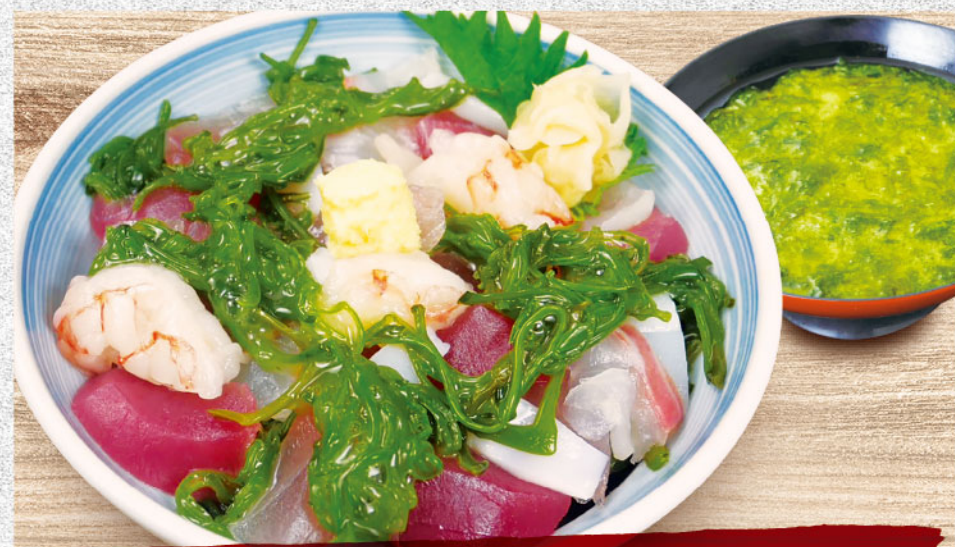
あれこれ海鮮めかぶ丼 1,580円