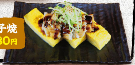
穴きゅう玉子焼 580円