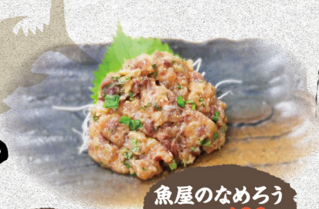
魚屋のなめろう 480円