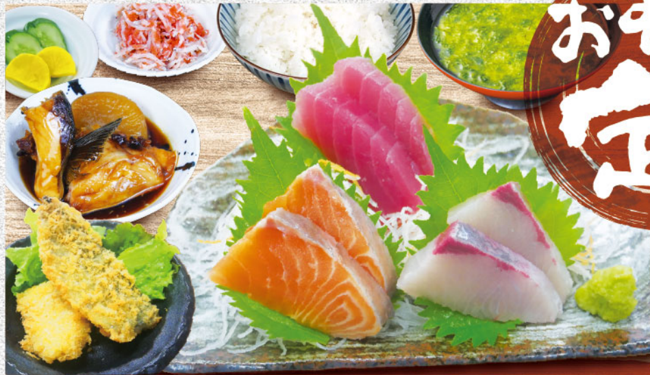
ヤマトサカナ定食 1,680円