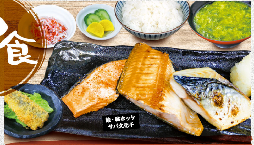
トリプル焼魚定食 1,480円