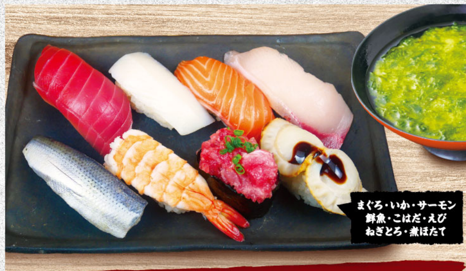
まぐろ・いか・サーモン 鮮魚・こはだ・えび ねぎとろ・煮ほたて