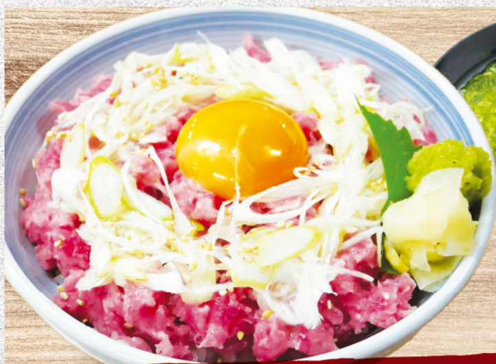
魚屋のネギトロ丼 1,580円