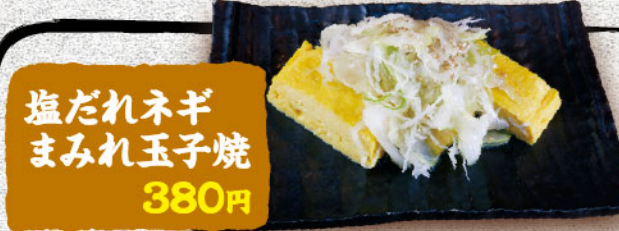
塩だれネギ まみれ玉子焼 380円