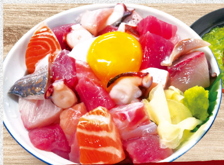
あれこれ海鮮丼 1,580円