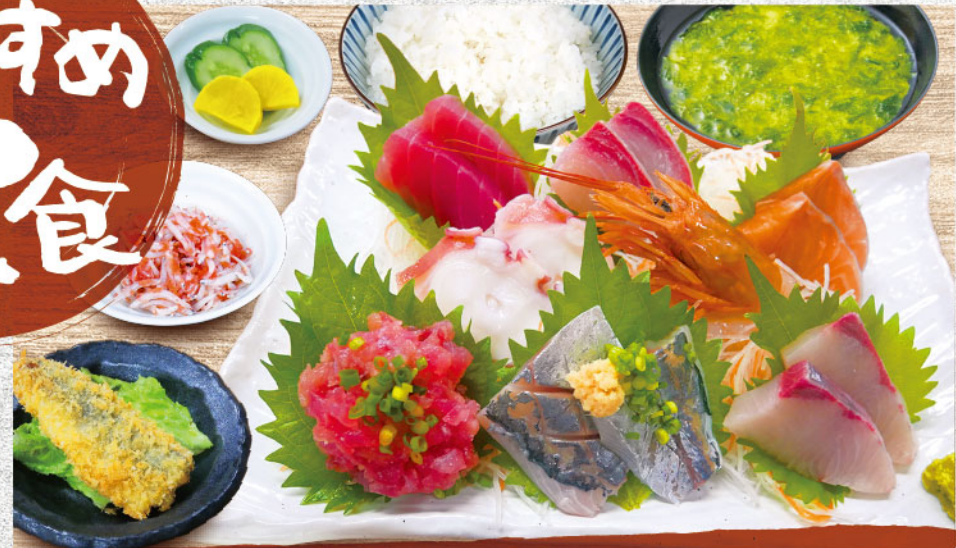
刺身8点盛り定食 1,980円