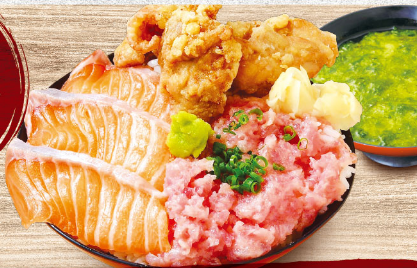
サーモン・ネギとろ・唐揚げ丼 1,580円