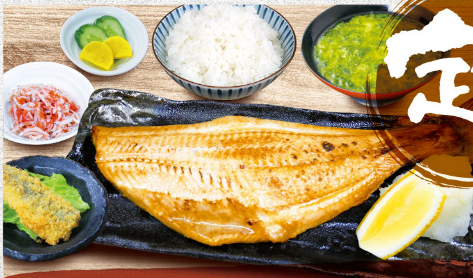
焼魚定食 鱈ホッケ 1,480円