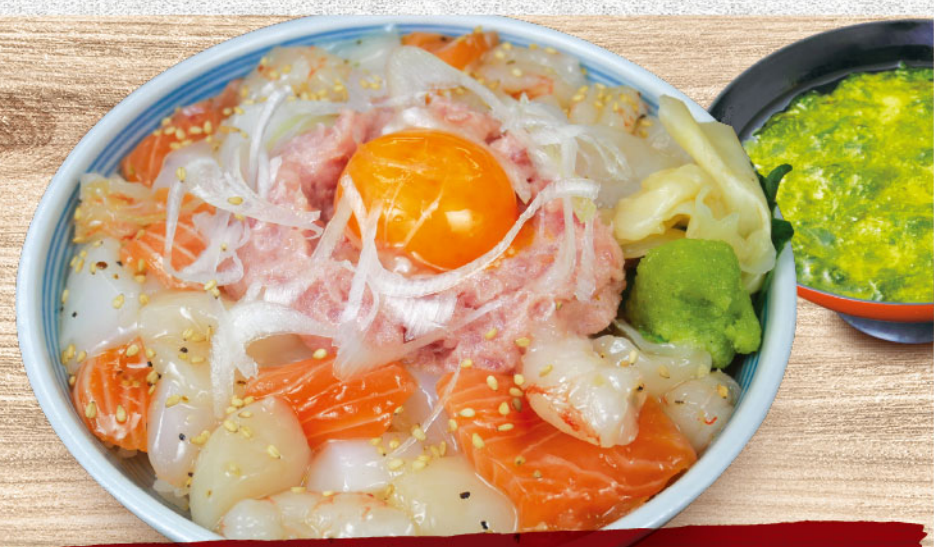
あれこれ海鮮ユツケ丼 1,580円