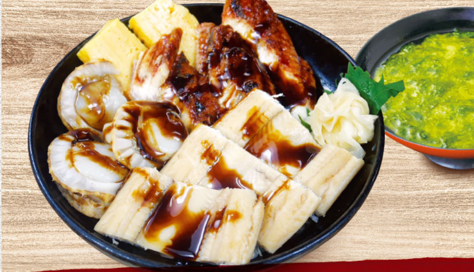
ウナ穴煮ほたて丼 1,880円