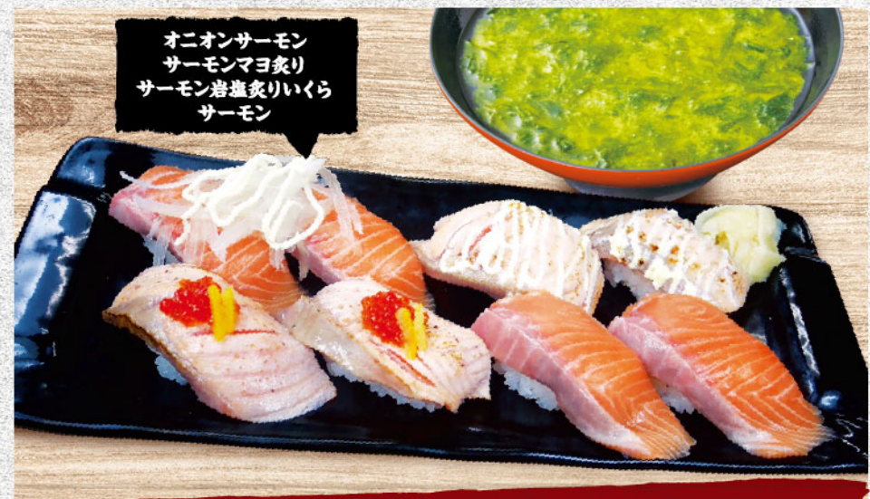
オニオンサーモン サーモンマヨ炙り サーモン岩塩炙りいくら サーモン