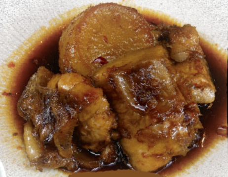
とろメカジキピリ辛煮 880円