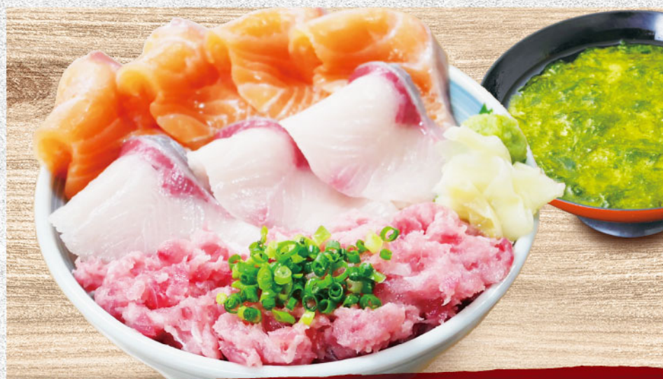
サーモン・ハマチ・ネギトロ丼 1,800円