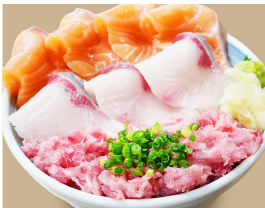
サーモン はまち ねぎとろ丼 1,880円