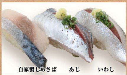
自家製しめさば あじ いわし