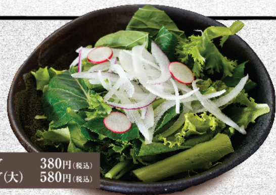
野菜サラダ 380円(税込) 野菜サラダ(大) 580円(税込)