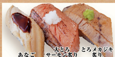
あなご 大とろサーモン炙り とろメカジキ炙り