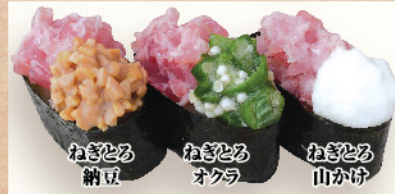
ねぎとろ納豆 ねぎとろオクラ ねぎとろ山かけ