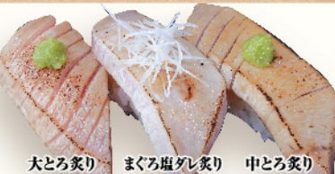
大とろ炙り まぐろ塩ダレ炙り 中とろ炙り