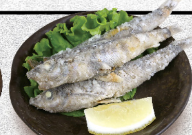
メヒカリの唐揚げ 480円(税込)