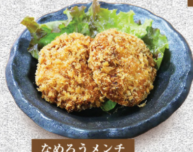
なめろうメンチ 580円(税込)