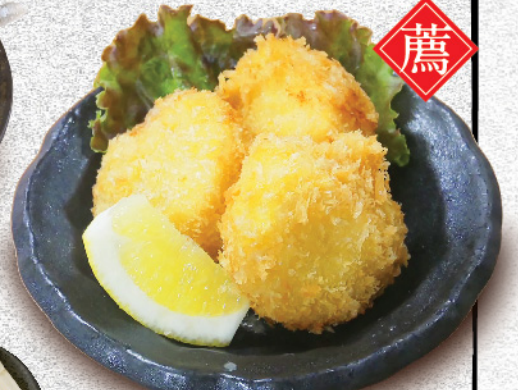
デカはたて貝柱フライ 1,380円(税込)