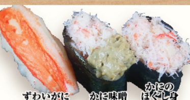
ずわいがに かほ味噌 かほのほぐし身