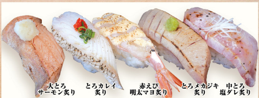
大とろサーモン炙り とろカレイ炙り 赤えび明太マヨ炙り とろメカジキ炙り 中とろ塩ダレ炙り