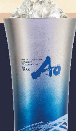
碧 Ao ハイボール 680円(税込)