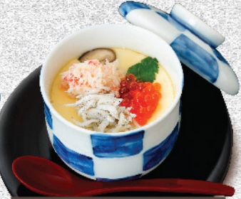
彩り茶碗蒸し 530円(税込)