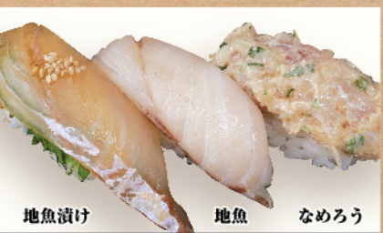
地魚漬け 地魚 なめろう