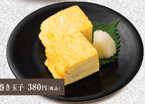
自家製だし巻き玉子 380円(税込)