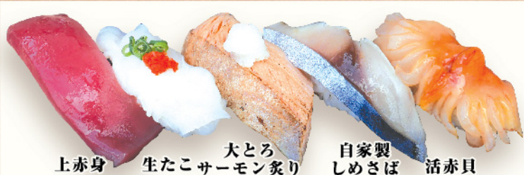
上赤身 生たこサーモン炙り 大とろサーモン炙り 自家製しめさば 活赤貝