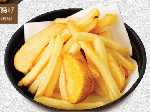
ポテトフライ 280円(税込)