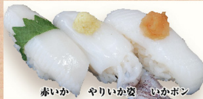
赤いか やりいか姿 いかボン