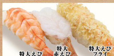
特大えび 特大赤えび 特大えびフライ