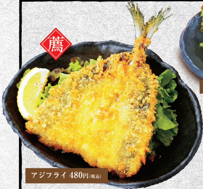
アジフライ 480円(税込)