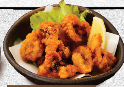
たこの唐揚げ 530円(税込)