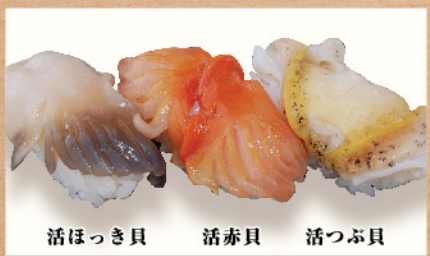
活ほっき貝 活赤貝 活つぶ貝