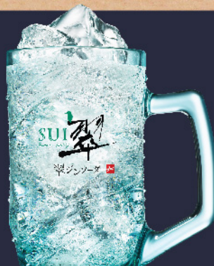
翠ジンソーダ 280円(税込)