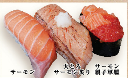
サーモン 大とろサーモン炙り サーモン親子軍艦