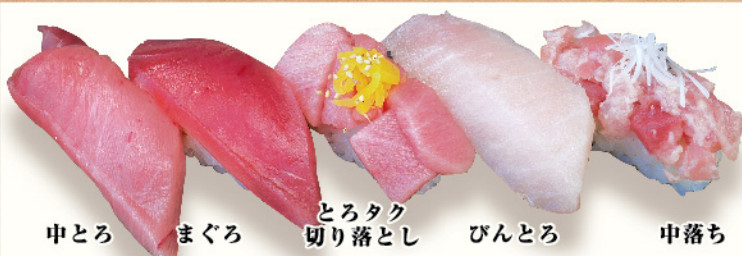
中とろ まぐろ とろたく切り落とし びんとろ 中落ち