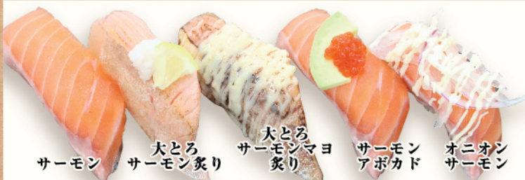
サーモン 大とろサーモン炙り 大とろサーモンマヨ炙り サーモンアボカド オニオンサーモン