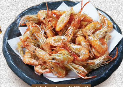
川えびの唐揚げ 480円(税込)