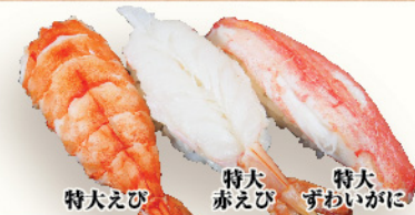
特大えび 特大赤えび 特大ずわいがに