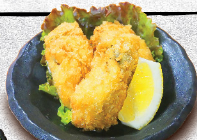
カキフライ 580円(税込)