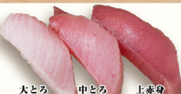
大とろ 中とろ 上赤身