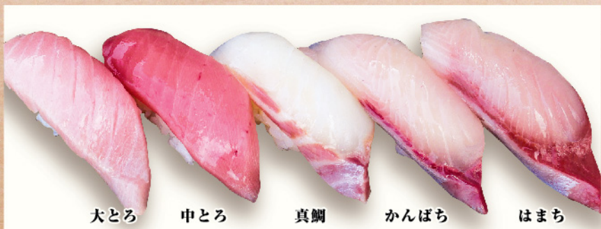
大とろ 中とろ 真鯛 かんぼち はまち