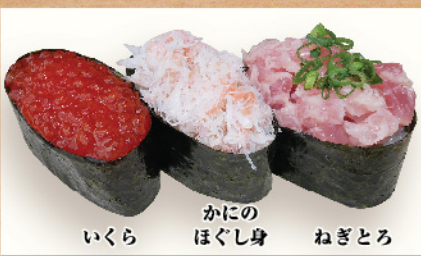
かにのほぐし身 いくら ねぎとろ