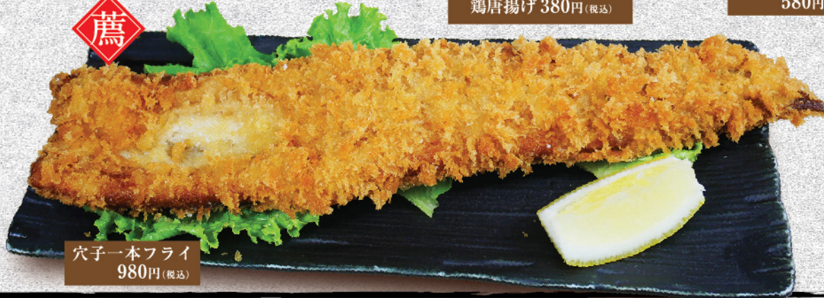
穴子一本フライ 980円(税込)