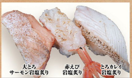
大とろサーモン岩塩炙り 赤えび岩塩炙り とろカレイ岩塩炙り