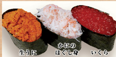
生うに かほのほぐし身 いくら