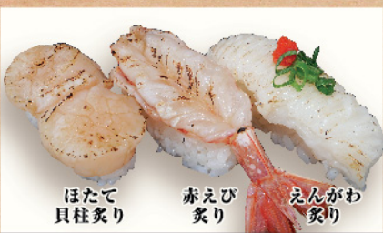
ほたて貝柱炙り 赤えび炙り えんがわ炙り