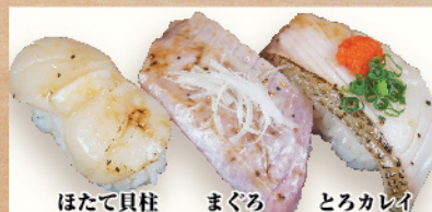
ほたて貝柱 まぐろ とろカレイ