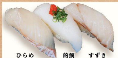
ひらめ 的鯛 すずき