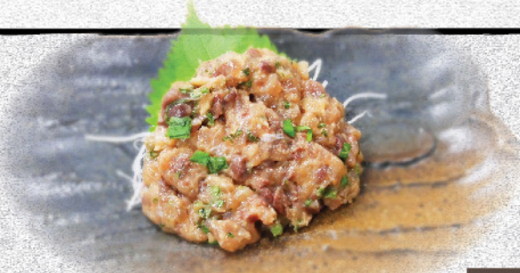
なめろうつまみ 580円(税込)