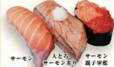
サーモン 大とろ サーモン炙り サーモン 親子軍艦