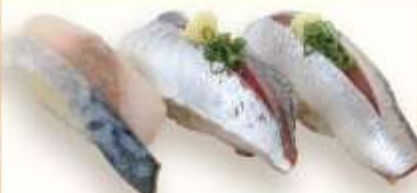
自家製しめさば あじ いわし