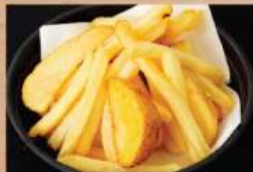
ポテトフライ 180円(税込)