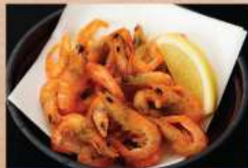
川えび唐揚げ 480円(税込)