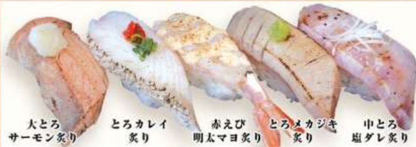
大とろ サーモン炙り とろカレイ 炙り 赤えび 明太マヨ炙り とろメカジキ 炙り 中とろ 塩ダレ炙り