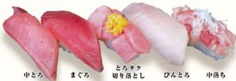
中とろ まぐろ とろタク 切り落とし びんとろ 中落ち