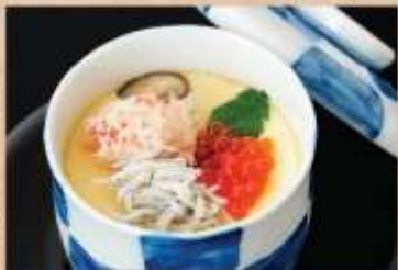
彩り茶碗蒸し 480円(税込)