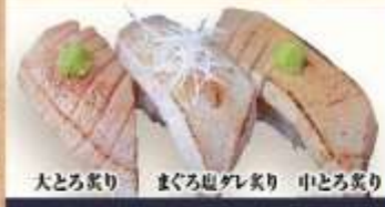
大とろ炙り まぐろ炙り 中とろ炙り