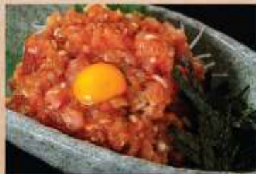
ねぎとろヌッケ 580円(税込)