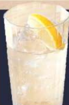
ブラックニッカハイボール 330円(税込)

香りやわらか、 味わいからやかな ブラックニッカクリアモ タンサンで割った、 クセのないクリアな 飲み心地の ハイボールです。