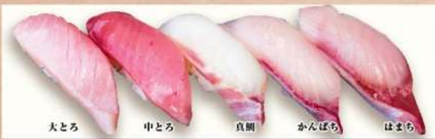
大とろ 中とろ 真鯛 かんぼち ほまち