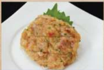
なめろうつまみ 480円(税込)