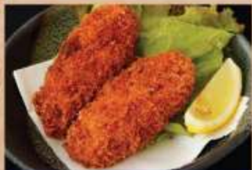
カキフライ 480円(税込)