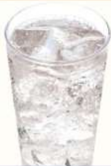
ジンソーダ 380円(税込)