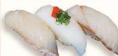
ひらめ 鰯の刺 すずき