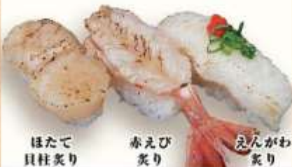
ほたて 貝柱炙り 赤えび 炙り えんがわ 炙り

食べればわかる活貝三貫 880円(税込) 活貝の内容は注文パネルでご確認下さい。