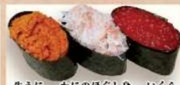
生うに かにのほぐし身 いくら