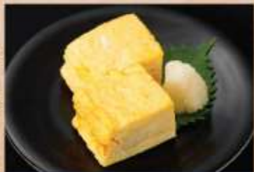
自家製だし巻き玉子 350円(税込)