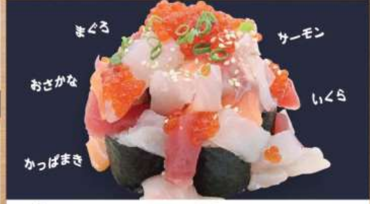
まぐろ サーモン おさかな いくら かっぱまき