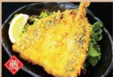
アジフライ 380円(税込)