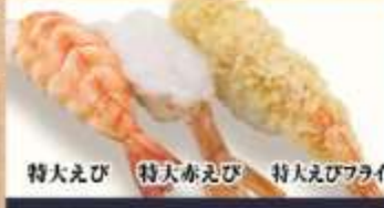
特大えび 特大赤えび 特大えびフライ