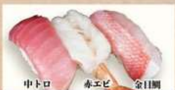
中トロ 赤エビ 金目鯛