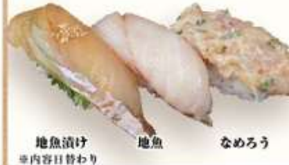
地魚漬け 地魚 なめろう ※内容日替わり