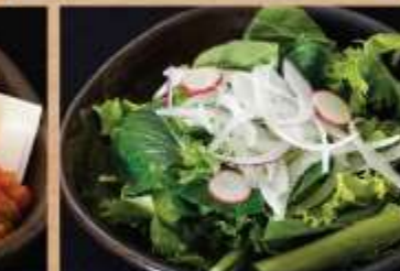
野菜サラダ 350円(税込) 野菜サラダ(大) 550円(税込)