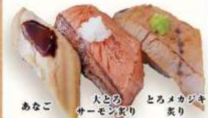
あなご 大とろ サーモン炙り とろメカジキ 炙り