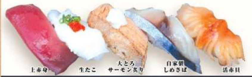
上赤身 生たこ 大とろ サーモン炙り 自家製 しめさば 活赤貝