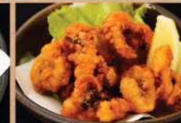
たこの唐揚げ 480円(税込)