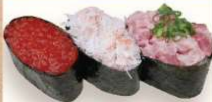
いくら かにのほぐし身 ネギトロ