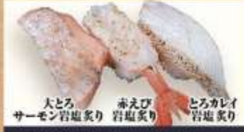
大とろ サーモン岩塩炙り 赤えび 岩塩炙り とろカレイ 岩塩炙り