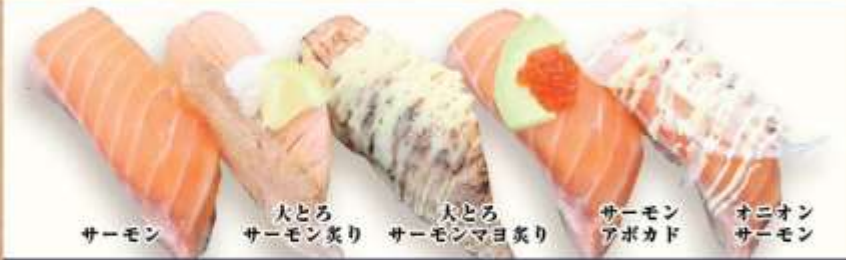
サーモン 大とろ サーモン炙り 大とろ サーモンマヨ炙り サーモン アボカド オニオン サーモン