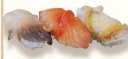
活ほっき貝 活赤貝 活つぶ貝

食べればわかる活貝三貫 880円(税込) 活貝の内容は注文パネルでご確認下さい。