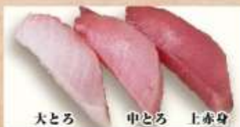
大とろ 中とろ 上赤身