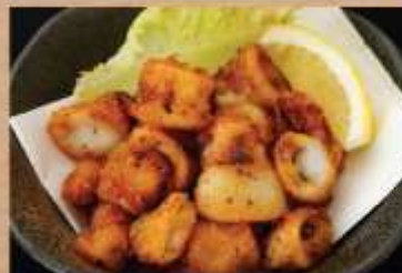
やわらかいかリング揚げ 480円(税込)