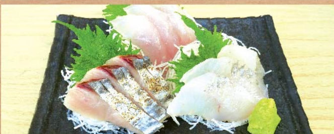
地魚三点盛 1,200 円(税込)