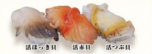
活ほっき貝 活赤貝 活つぶ貝

食べればわかる活貝三貫 880円(税込) 活貝の内容は注文パネルでご確認下さい。