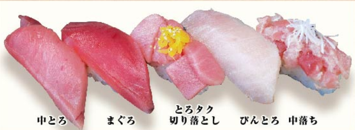
中とろ まぐろ とろたく切り落とし びんとろ 中落ち