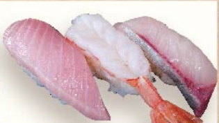
やまと三貫 820円(税込)