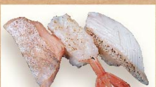
岩塩炙り三貫 580円(税込)