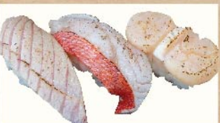
極上岩塩炙り三貫 880円(税込)