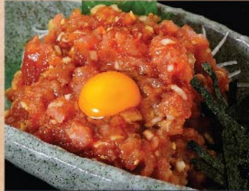
ねぎとろユッケ 580 円(税込)