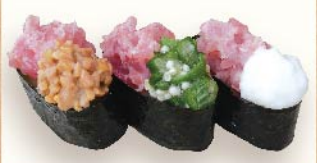
ネバとろ三貫 380円(税込)