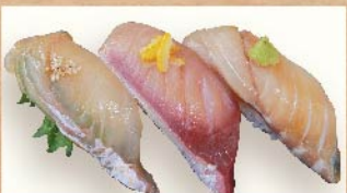
鮮魚漬け三貫 540円(税込)