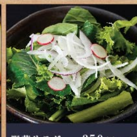
野菜サラダ 350 円(税込) 野菜サラダ(大) 550 円(税込)