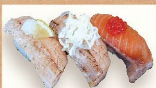
サーモン三貫 640円(税込)