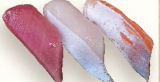
とろ三貫(限定品) 820円(税込)