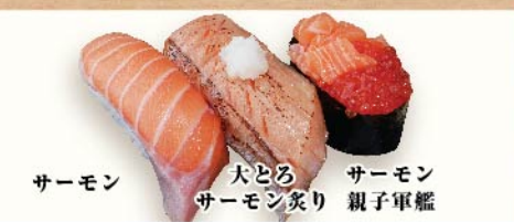
サーモン 大とろサーモン炙り サーモン親子軍艦