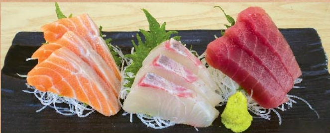
刺身三点盛 1,200 円(税込)