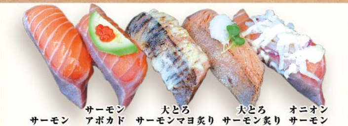
サーモン サーモン アボカド 大とろサーモン炙り 大とろサーモン炙り オニオンサーモン