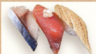
たくみ巧三貫 520円(税込)