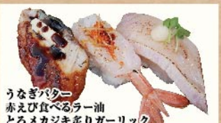
うなぎバター赤えび食べるラー油とろメカジキ炙りガーリックスタさん【スタミナ三貫】 750円(税込)