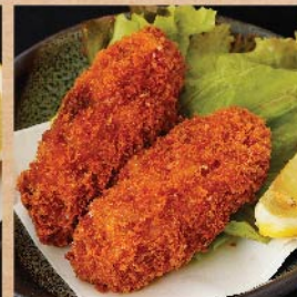
カキフライ 480 円(税込)