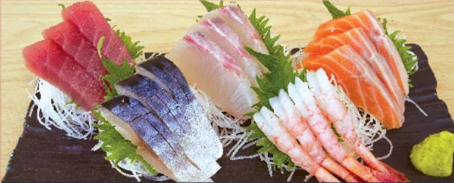
刺身五点盛 1,800 円(税込)