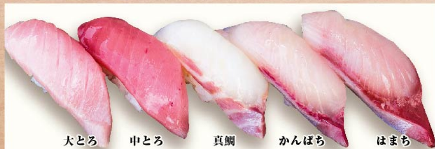
大とろ 中とろ 真鯛 かんぼち はまち