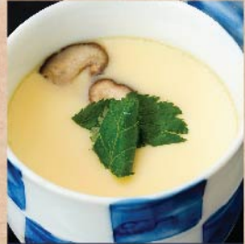
茶碗蒸し 290 円(税込)