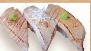
まぐろ炙り三貫 750円(税込)