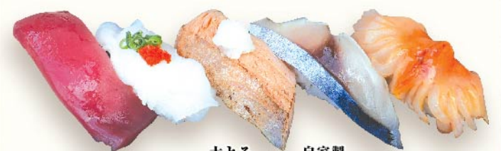
上赤身 生たこ 大とろサーモン炙り 自家製しめさば 活赤貝