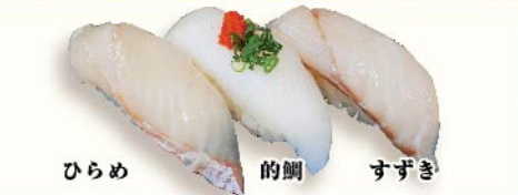
ひらめ 的鯛 すずき