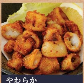
やわらか いかリング揚げ 480 円(税込)