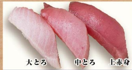
大とろ 中とろ 上赤身