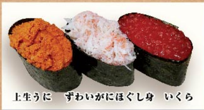
上生うに ずわいがにほぐし身 いくら