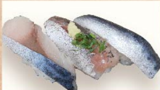
ブルー・スリー【青魚三貫】 460円(税込)