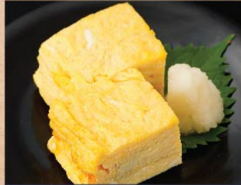
自家製だし巻き玉子 350 円(税込)