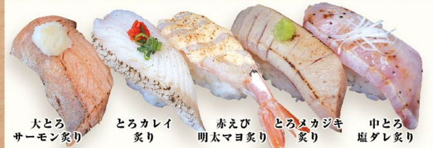
大とろサーモン炙り とろカレー炙り 赤えび明太マヨ炙り とろメカジキ炙り 中とろ塩ダレ炙り