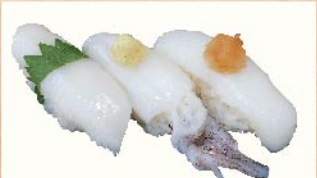
イカさん貫 380円(税込)