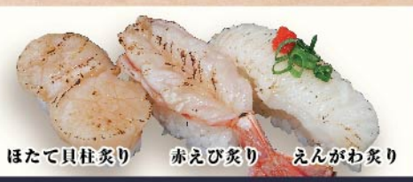
ほたて貝柱炙り 赤えび炙り えんがわ炙り