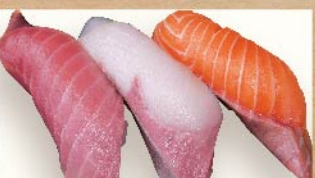
すてれっばつ三貫 980円(税込) 【房州弁で漬く大きい】