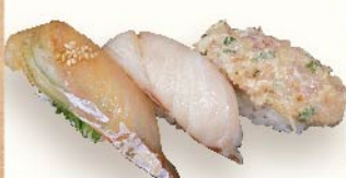
南房総三貫 580円(税込)