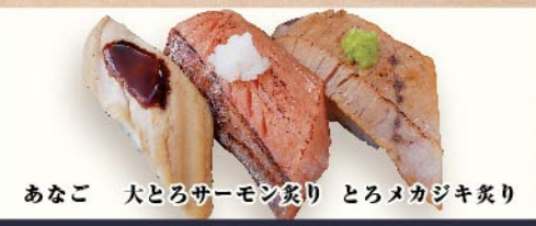
あなご 大とろサーモン炙り とろメカジキ炙り