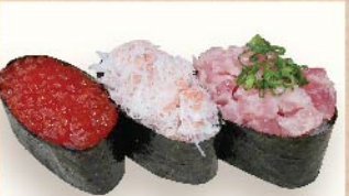
いろど彩り三貫 640円(税込)