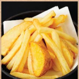
ポテトフライ 160 円(税込)